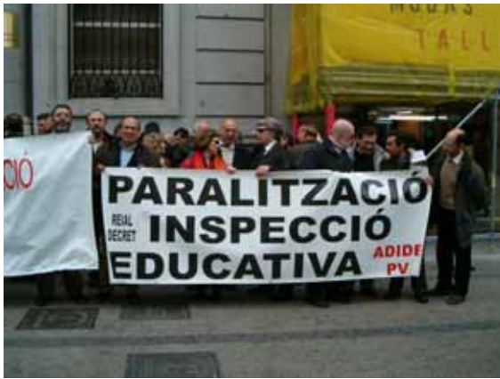
Un aspecte de la concentració

En el marc de les accions que ADIDE – Federació ha mamprés per tal d'intentar la retirada del Reial Decret 1538/2003 i parilitzar el procés d'adscripció, el propassat dissabte 6 de març un nombrós grup d'Inspectors d'Educació procedents de tot l'Estat es va concentrar davant del Ministeri del ram i va presentar un escrit adreçat a la titular