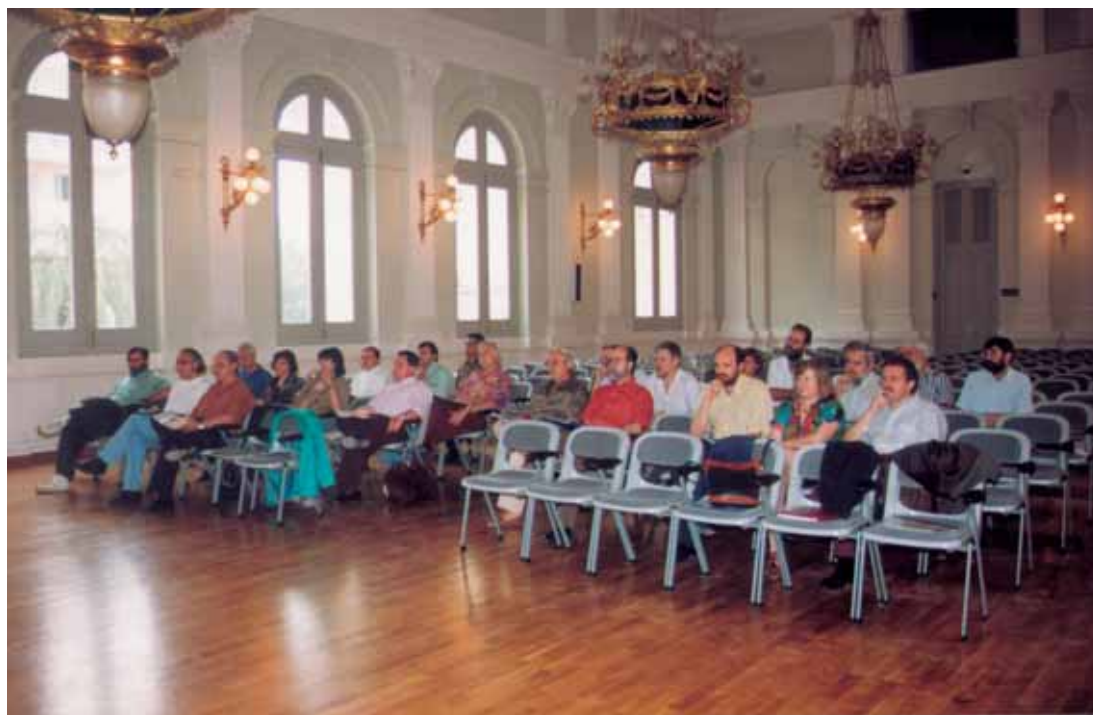
Jornades d'ADIDE - PV. Xàtiva Juny 1992

fulls d'inspecció és una publicació de l'Associació d'Inspectors d'Educació del País Valencià (ADIDE-PV).